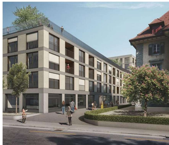
Lindenpark in Kriens