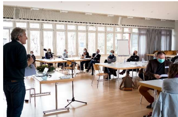
Workshop vom 4. Dezember 2020