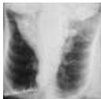
2. Schulter Schmerzen bei operiertem Mammakarzinom

Bei der Patientin musste ein Jahr später bei Radionekrose der Clavicula mit Fraktur wegen therapierbarer Schmerzen eine Osteosynthese vorgenommen werden.